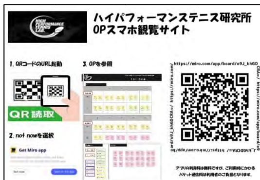
Miroを登録するためのサイト